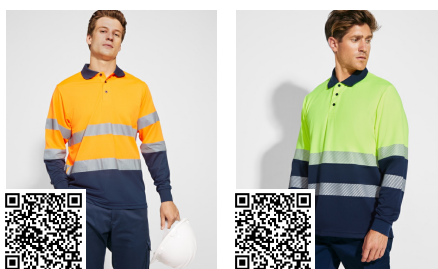
POLARIS L/S HV9306