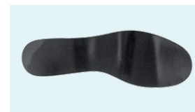
PLANTA ACERO ANTIPERFORACIÓN 1100 N