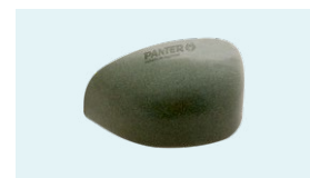
PUNTERA ACERO Anti-impactos 200 J