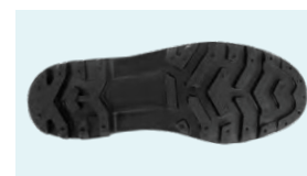
SUELA PVC + CAUCHO NITRILO