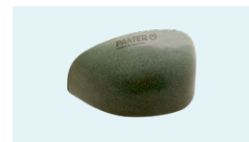
PUNTERA ACERO Anti-impactos 200 J