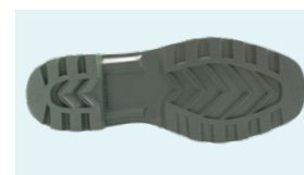
SUELA PVC + CAUCHO NITRILO

Tel: (+34) 965 310 613 Fax: (+34) 965 312 185