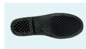
SUELA PVC Diseño especial, no almacena barro

Tel: (+34) 965 310 613 Fax: (+34) 965 312 185