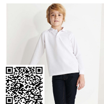
CARPE CHILD PO5008