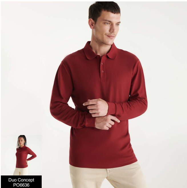
Duo Concept PO6636