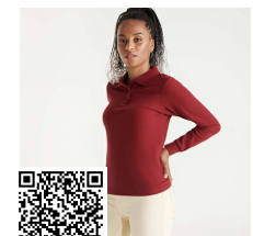
ESTRELLA WOMAN L/S PO6636