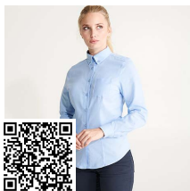
OXFORD WOMAN CM5068