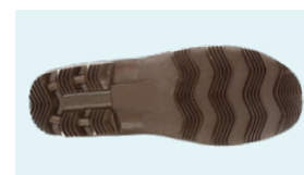
SUELA PVC + CAUCHO NITRILO

Tel: (+34) 965 310 613 Fax: (+34) 965 312 185