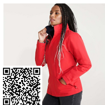
EUROPA WOMAN PK5078