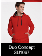
Duo Concept SU1067