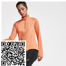
MELBOURNE WOMAN CA1114