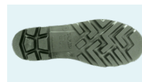
SUELA PVC + CAUCHO NITRILIO

Tel: (+34) 965 310 613 Fax: (+34) 965 312 185