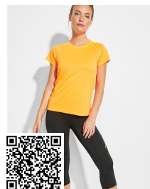
ICARIA WOMAN LG6695