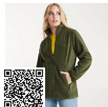
ARTIC WOMAN CQ6413