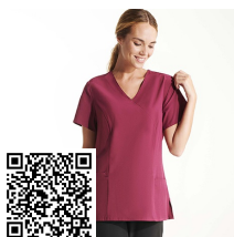
FEROX WOMAN CA9084