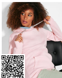
URBAN WOMAN SU1068